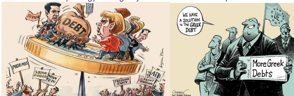
A pénzügyi válság idején közzétett satirikus képek

Érveidet tényekre alapozd és vedd figyelembe a történelmi kontextust. Használj megbízható forrásokat az érveid alátámasztására, és kerüld a téves információk terjesztését. Ez biztosítja a konstruktívabb és tájékozottabb beszélgetést. Légy tudatában annak, hogy a görög pénzügyi válságról folytatott viták eltérő nézőpontokat foglalhatnak magukban. Vesd össze a különböző érintettek, köztük a közgazdászok, a politikai döntéshozók és a közvélemény álláspontját. Vedd figyelembe, hogy a vélemények az egyéni tapasztalatok és elemzések alapján eltérőek lehetnek. Élj a lehetőséggel arra, hogy a vita során tanulj a történelmi eseményekből. Gondold át, hogy a görög pénzügyi válság tanulságai hogyan szolgálhatnak alapul a jövőbeni gazdasági kihívásokra vonatkozó szakpolitikák és megközelítések számára.